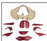
写真1. 骨盤、男性モデル(腰椎4-5番付) AV-33 ￥25,190 (本体価格¥22,900)

写真2. 骨盤、女性モデル(腰椎4-5番付) AV-34 ￥28,050 (本体価格¥25,500)