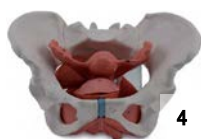
写真4. 骨盤腔、女性モデル P-102 ￥36,300 (本体価格¥33,000)

写真3. 女性骨盤と骨盤底筋・生殖器モデル AV-589.3 ￥44,000 (本体価格¥40,000) ※在庫限り