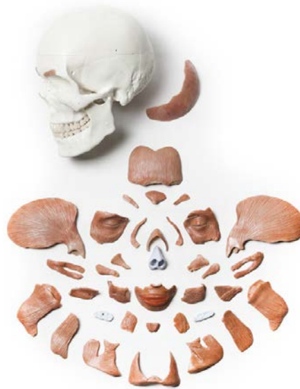
全ての筋の構成。主にマグネットで着脱されます。頭蓋骨は3分解。

筋パーツは全40分解。扱い易さも求められます。埋め込みマグネットとナイロンピンによる、簡単分解に努めました。さらに、便利で詳しいガイド冊子が付属します。