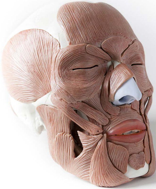
学術的に正確で詳細な美しい製品